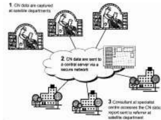
شکل ۱) ارسال داده از طریق شبکه امن به سرور مرکزی برین و همکاران. انفورماتیک پزشکی و تصمیم‌گیری. بی‌ام‌سی ۲۰۰۰

نمونه‌ای از پزشکی از راه دور است. حجم‌های اصلاح تصاویر (STIC) ۲۴ به سه مرکز مراقبتی دارای اندوکاردیوگرافی چهار بعدی ارسال می‌شود.