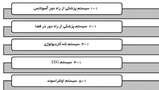
نمودار ۱) انواع سیستم‌های بیسیم و سیار در پزشکی از راه دور بر اساس فن‌آوری‌های بیسیم و نوع خدمات

انواع سیستم‌های بیسیم و سیار در پزشکی از راه دور بر اساس فن‌آوری‌های بیسیم و نوع خدمات ارائه دهنده: طبق مطالعات انجام شده انواع سیستم‌های بیسیم و سیار در پزشکی از راه دور طراحی شده تا به حال در نمودار ۱ نشان داده شده است.